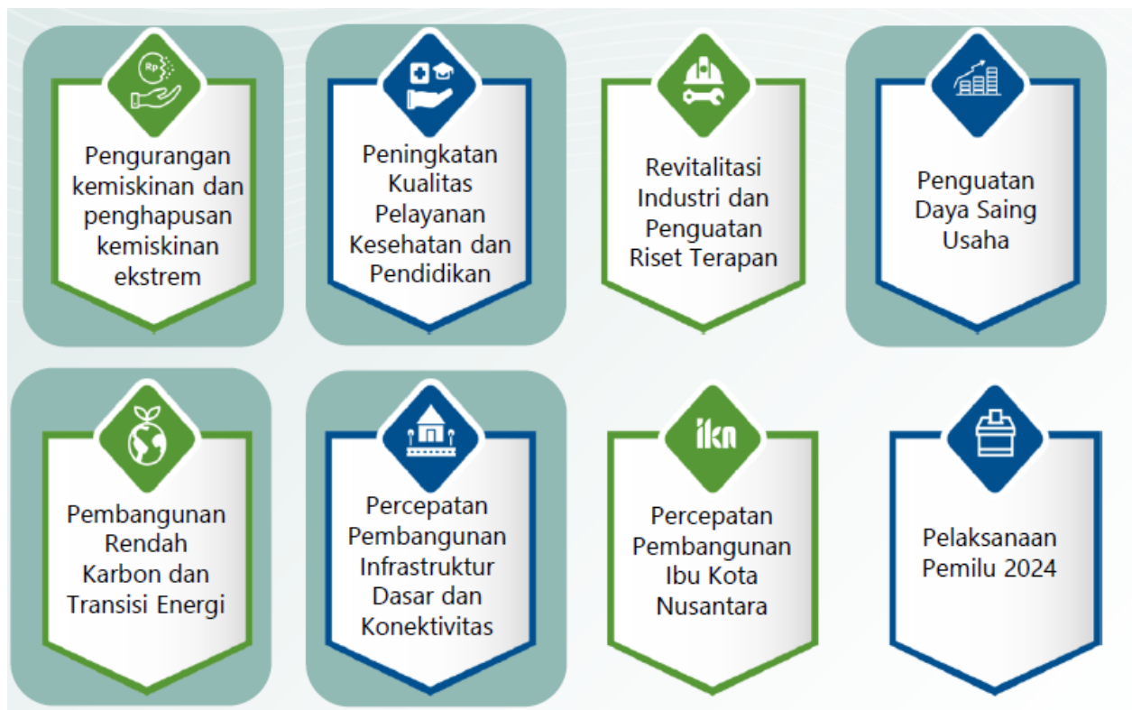
Gambar 3.1 Arah Kebijakan RKP Tahun 2024

Pada Tahun 2024, Tema Pembangunan Nasional yang ditetapkan dalam RKP Tahun 2024 adalah "Mempercepat Transformasi Ekonomi yang Inklusif dan Berkelanjutan" dengan 8 arah kebijakan sebagai berikut: